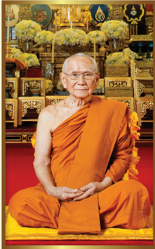
สมเด็จพระอริยวงศาคตญาณ (อมฺพรมหาเถร) สมเด็จพระสังฆราช สกลมหาสังฆปริณายก