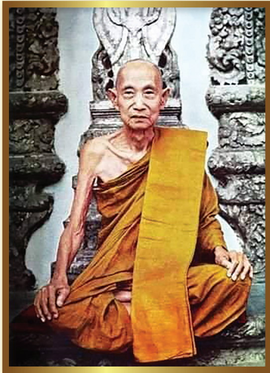
สมเด็จพระสังฆราชเจ้า กรมหลวงวชิรญาณวงศ์