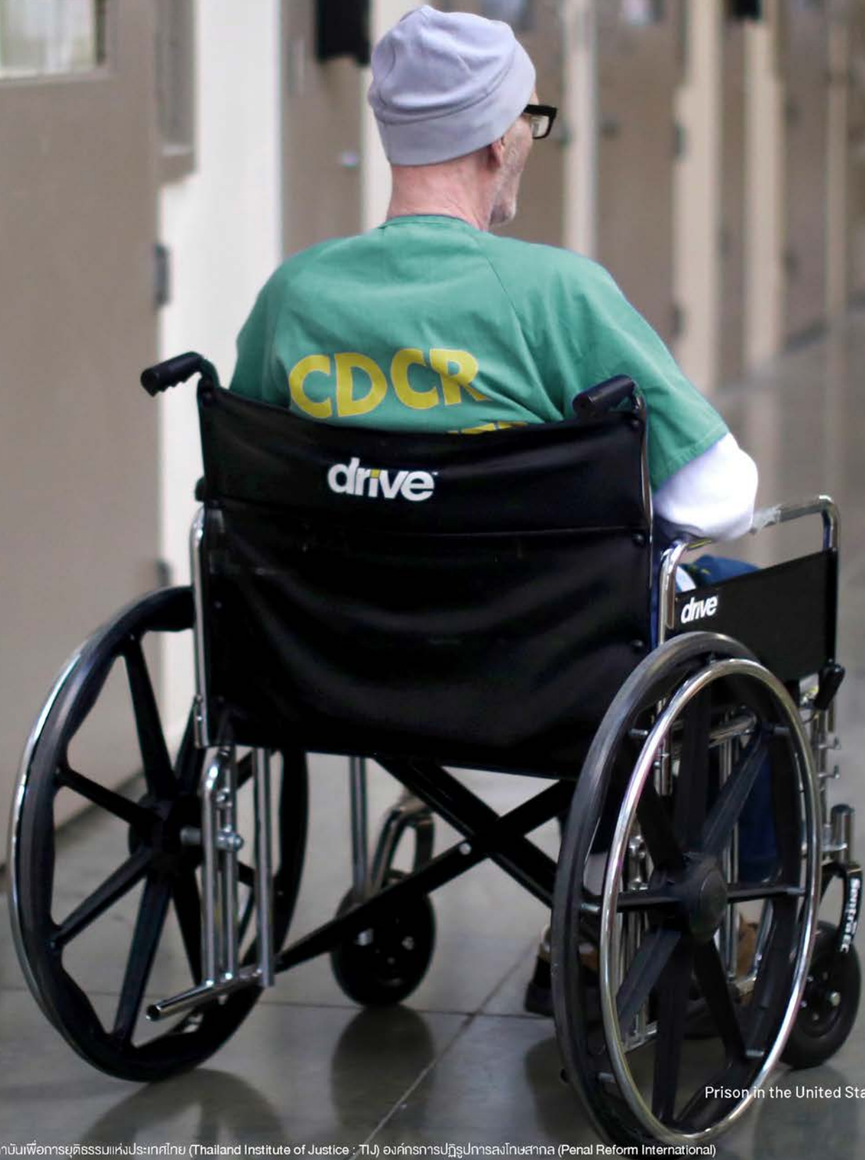
Prison in the United States.

การใช้ชีวิตในแต่ละวันของผู้ต้องขังที่เป็นคนพิการ ล้วนเผชิญความยากลำบาก และปัญหาข้อท้าทายต่าง ๆ ในทุก ๆ วัน ที่อยู่ในเรือนจำ พวกเขาอาจจะถูกคุมตัวไว้ในห้องขัง หรือถูกจำกัดโอกาสที่จะได้ออกกำลังกาย