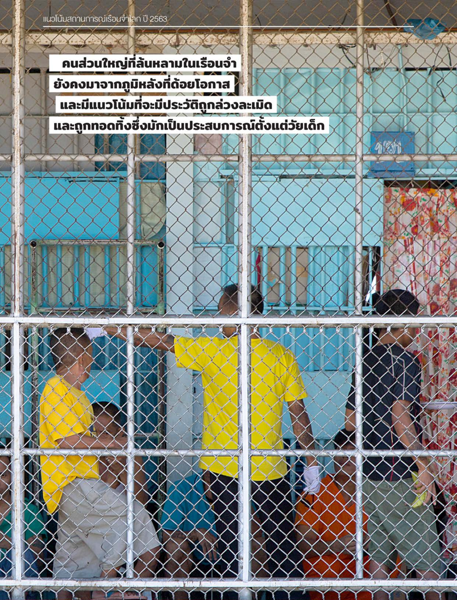
Adults and children in a detention centre in the Philippines.

คนส่วนใหญ่ที่ล้นหลามในเรือนจำ ยังคงมาจากภูมิหลังที่ด้อยโอกาส และมีแนวโน้มที่จะมีประวัติถูกล่วงละเมิด และถูกทอด้งซึ่งมักเป็นประสบการณ์ตั้งแต่วัยเด็ก