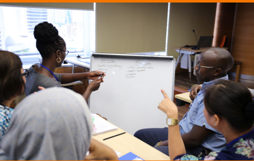
เจ้าหน้าที่ราชทัณฑ์อาเซียนศึกษาดูงาน ณ เรือนจำต้นแบบจังหวัดพระนครศรีอยุธยา