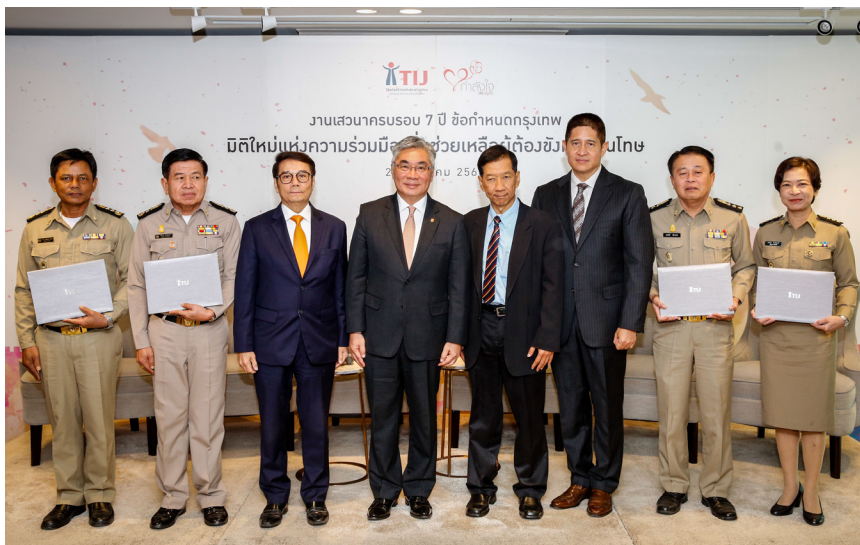
พิธีมอบประกาศนียบัตรโครงการ เรือนจำต้นแบบ พ.ศ. 2560

ในการนี้ TIJ มีแนวคิดขยายการพัฒนาเรือนจำต้นแบบตามข้อกำหนดกรุงเทพ ให้เกิดขึ้นในทั่วทุกภูมิภาคของประเทศ เพื่อให้เกิดการศูนย์การเรียนรู้สำหรับ เจ้าหน้าที่ราชทัณฑ์ไทย และเจ้าหน้าที่ราชทัณฑ์อาเซียน โดยมุ่งหวังให้เรือนจำ ที่ได้รับการคัดเลือกให้เป็นเรือนจำต้นแบบเป็นตัวอย่างเชิงรูปธรรม ที่สะท้อนถึงความสำเร็จในการนำเอาข้อกำหนดกรุงเทพไปปรับใช้จริง ภายใต้ข้อจำกัดต่างๆ และสืบทอดความมุ่งมั่นของรัฐบาลไทยในการยกระดับการปฏิบัติต่อผู้ต้องขังหญิงที่สอดคล้องตามมาตรฐาน ระหว่างประเทศ ด้วยเหตุนี้ TIJ จึงเริ่มดำเนินการเปิดรับสมัครเรือน จำและทัณฑสถานในเขตภาคเหนือ ภาคตะวันออกเฉียงเหนือ และภาคใต้ ในระหว่าง พ.ศ. 2560 - 2562 เพื่อเชิญชวนเรือนจำและทัณฑสถาน ในภูมิภาคต่างๆ ที่สนใจได้เข้าร่วมโครงการเรือนจำต้นแบบต่อไป