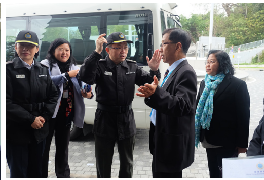
การศึกษาดูงานของผู้แทนเรือนจำ ที่เข้าร่วมโครงการเรือนจำต้นแบบ ณ กรมราชทัณฑ์เขตบริหารพิเศษฮ่องกง แห่งสาธารณรัฐประชาชนจีน