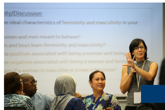
ity/Discussion The ideal characteristics of femininity and masculinity in your women and men meant to behave? Is and boys learn femininity and masculinity? The positives associated with being a woman and being The negatives associated with being a woman and being If a woman is masculine or a man is feminine?