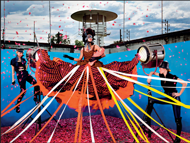
The Light Princess