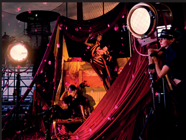
Princess and the Pea

หลังจากที่ได้รับความไว้วางใจจากสถาบันเพื่อความยุติธรรมให้ประเทศไทย ผมได้ตัดสินใจเข้าไปหาข้อมูลในก้นหีบถาดหนัง จังหวัดชลบุรี เพื่อสอบถามและทำความเข้าใจเกี่ยวกับชีวิต ความหวัง และความฝัน ของผู้ต้องงังหญิงที่ต้องเลี้ยงลูกอยู่ในคุก แนวความคิดหลักของภาพทั้ง 3 ภาพคือ “ความเป็นแม่” ที่ไม่ว่าที่ยุค ที่สมัยไม่ว่าจะอยู่ที่ใด ความเป็นแม่ก็ไม่มีวันเปลี่ยนแปลง 3 ความฝันของแม่ จากก้นหีบถาดหนัง ได้ถูกนำมาเป็นการจัดวางองค์ประกอบ ของภาพทั้ง 3 ภาพ โดยใช้การเล่าเรื่องจากนิทานคลาสสิกที่แม่เล่าให้ลูกฟังก่อนนอน