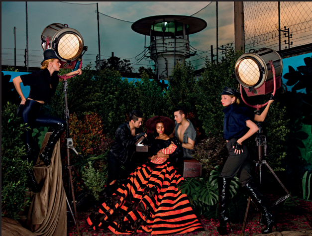
The Pandora Box