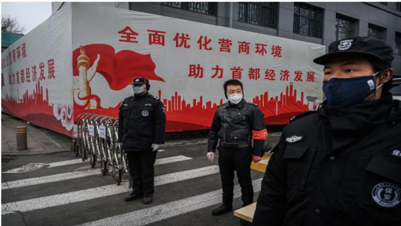
A Chinese man who is a member of the neighborhood committee, center, and security guards wear protective masks as they control entry and exit from a residential area on February 20, 2020 in Beijing, China. Kevin Frayer