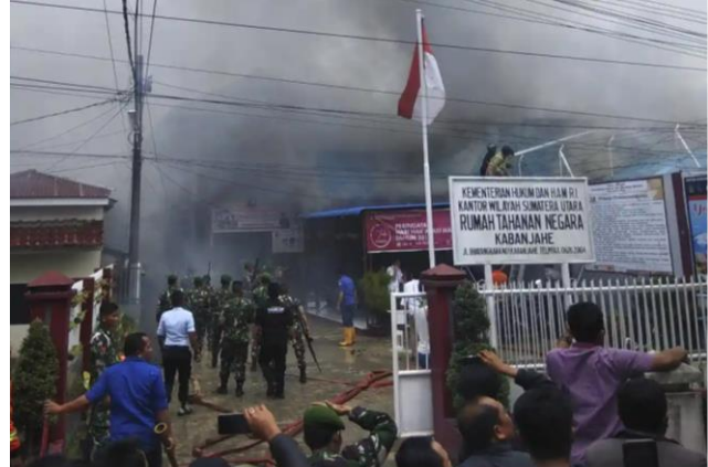
▲ Riots have broken out in overcrowded jailed as prisoners demand release.